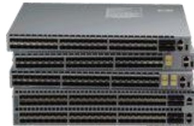
Arista 7050SX シリーズの 1/10GbE および 10/40GbE スイッチ 上から下の順で 7050SX-64、7050SX-72、7050SX-128、7050SX-96

7050X シリーズは、Arista EOS との組み合わせによって、ビッグデータ、クラウド、仮想化、また従来型ネットワーク向けの高度な機能を提供します。