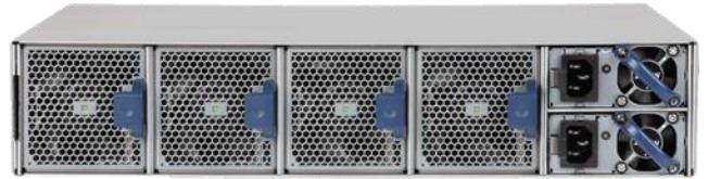
Arista 7050X 2RU の背面: 背面吸気/前面排気エアフローのモデル