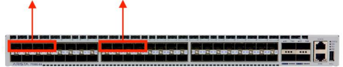
Arista 7150S の AgilePort - 4 つの SFP+ ポートをグループ化して 40GbE を実現