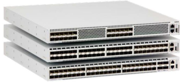
Arista 7150S ファミリ

非常に低いレイテンシーが求められる金融 ECN、HPC クラスタ、クラウド・データセンターといった要件の厳しい環境に対応するように設計されており、最小 350 ナノ秒という業界最小クラスの確定的なレイテンシーを実現します。また、ミッション・クリティカルな環境を監視および制御するための高度なツール・セットを備えます。